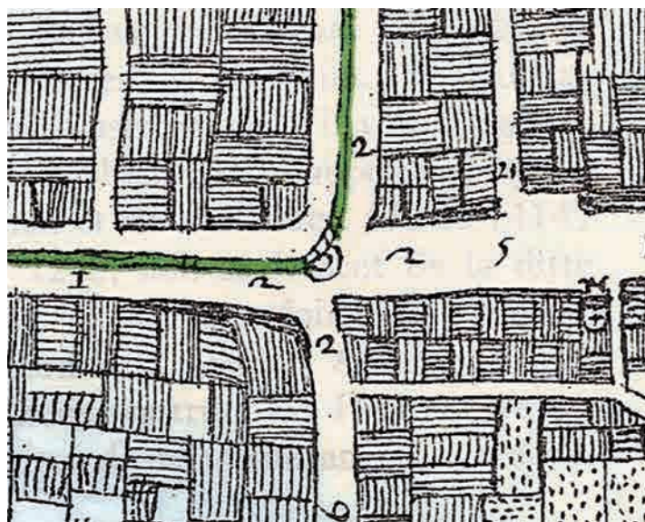
Particolare del Plan di De Tillier (1730); all'incrocio delle vie, la collocazione della Croix-de-Ville (J.-B. DE TILLIER, Historique de la Vallée d'Aoste , I.T.L.A., Aoste 1968).

Ma lo storico valdostano prosegue dicendo