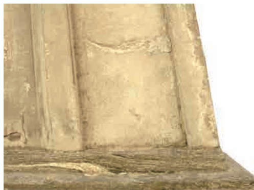
All'estrema destra malta di giuntura della lastra settentrionale con quella orientale.

Il 30 novembre 1841 la "Feuille d'Annonces d'Aoste" dà notizia dell'avvenuto restauro della Croix-de-Ville in un articolo su due colonne a firma del canonico Louis Gorret 62 . Il contenuto di alcuni passaggi dell'articolo merita di essere riportato: