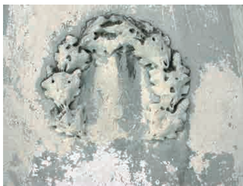
Le iniziali del prevosto Antonio Varesini sul fianco settentrionale del basamento.