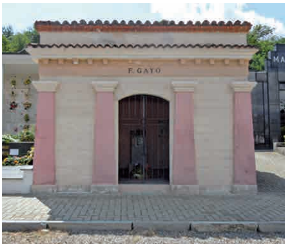
La cappella della famiglia Gayo nel cimitero di Scarmagno.

la più grande, detta “Pozzo Sonza”, è stata restaurata di recente e fa parte del “circuito delle fontane di Lessolo”.