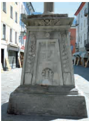
La Croix-de-Ville. Fianco settentrionale.