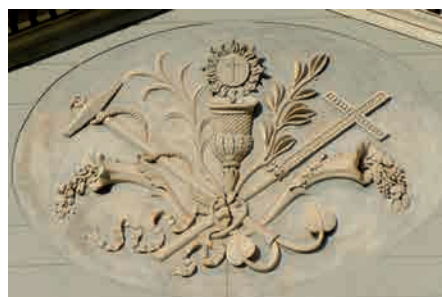
Facciata della Cattedrale Santa Maria Assunta di Aosta. Particolare del rilievo centrale del timpano.