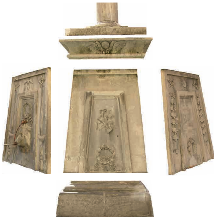
Tav. I Il piedestallo della Croix-de-Ville scomposto nelle sue parti (vista dal fronte orientale)

Ce monument consiste en une croix, de marbre gris, de la hauteur d'environ 6 mètres. L'architecture du piédestal est égyptienne; on y remarque des hiéroglyphiques et divers ornements religieux. [...] Au-dessus de l'inscription rayonne une gloire, au milieu de laquelle se trouve le monogramme du Saint-Nom de Jésus [...]. Cette gloire fut adoptée par nos pères, à l'occasion de la fuite du même hérésiarque comme le signe emblématique de leur profession de foi. Ils la placèrent au frontispice de leurs maisons, ou plusieurs se sont conservées jusqu'à nos jours. [...] La croix proprement dite et la colonne cylindrique qui la supporte ne sont point changées ».