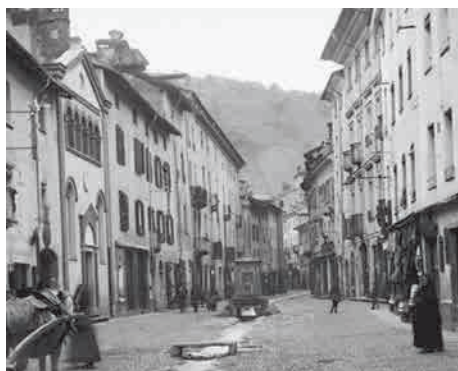
La Croix-de-Ville in una foto scattata in epoca successiva al 1900; sul lato sinistro il tempio valdese.

L'aspetto odierno del monumento, già dotato di vasca-fontana addossata sul lato meridionale nel 1841, non è molto dissimile da quanto visibile in un documento fotografico dei primi anni del Novecento. L'unica differenza consta nella breccia centrale del basamento realizzata per consentire lo scorrimento del ruscello a centro strada 61 .