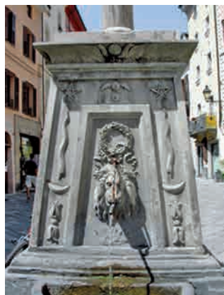
La Croix-de-Ville. Fianco meridionale.