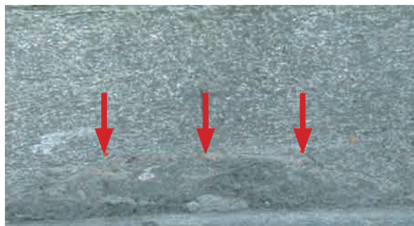
Profilo della giuntura (frecce rosse) tra la pietra dello zoccolo del basamento e l'inserito in pietra applicato per tamponare la breccia in cui passava il rivo al centro strada.

canonico effettivo della Cattedrale di Aosta nel 1828; segretario del vescovo Agodino dal 1824 al 1838, viene nominato prevosto nel 1831 e consacrato arcivescovo di Sassari dallo stesso André Jourdain il 14 ottobre 1838 65 .