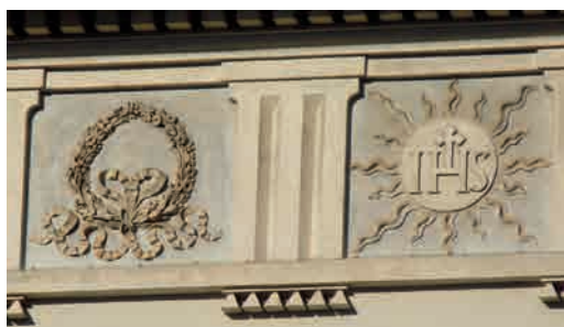
Facciata della Cattedrale Santa Maria Assunta di Aosta. Particolare dei rilievi delle metope.

Se l'ornato a tema religioso ricalca un'iconografia quanto mai diffusa e nota, da sempre ci si interroga sul significato degli altri simboli. Una tradizione orale tuttora viva fa spesso ricorso a suggestioni magico-esoteriche e a simbologie massoniche per spiegare ciò che appare ancora oggi un enigma. Non è necessario scomodare questi contesti per spiegare la sostanza della scelta iconografica, di fatto già resa pubblica nell'articolo apparso sulla stampa locale in occasione della sua inaugurazione e benedizione. Il canonico Gorret