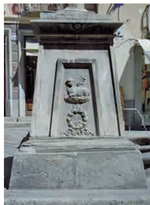
La Croix-de-Ville. Fianco occidentale.

con il trigramma, le corone d'alloro nastrate e l'intreccio del calice con la croce sono pressoché identici.