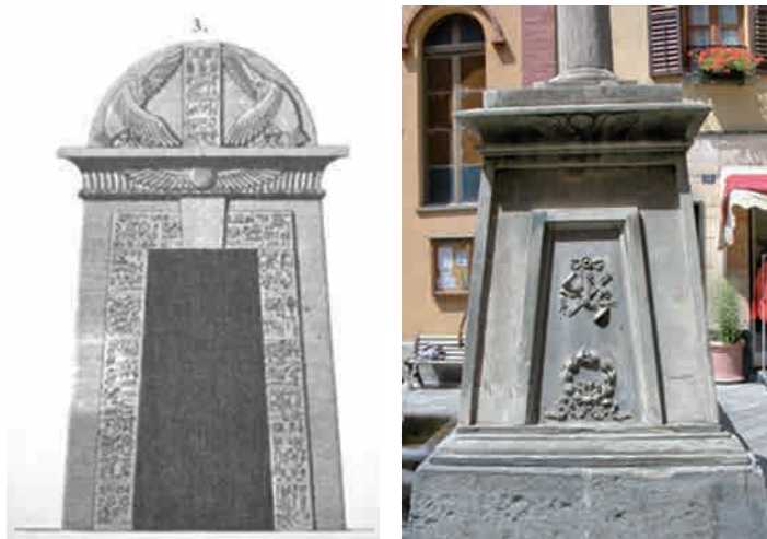
Portale di tempio egizio (da D. VIVANT DENON, Voyage dans la Basse et Haute Égypte pendant les campagnes du général Bonaparte , Paris 1802).