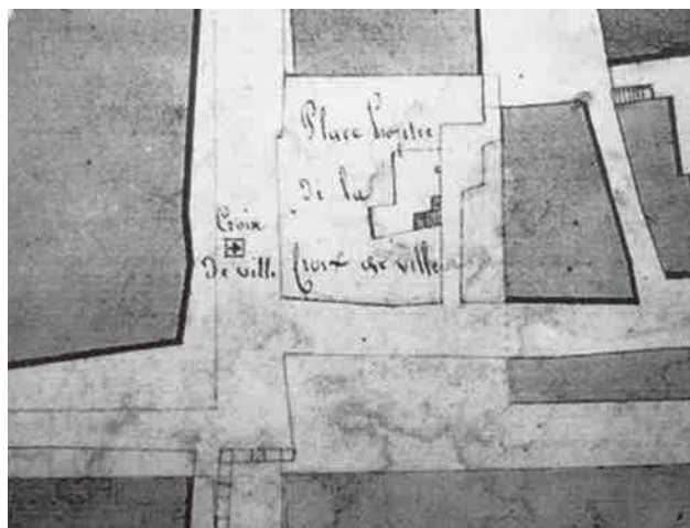
La Croix-de-Ville nel Piano Grosso del 1827.