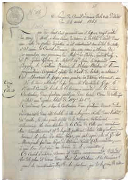
Verbale del Consiglio Comunale di Aosta del 1841 in cui si delibera la ricostruzione della Croix-de-Ville.